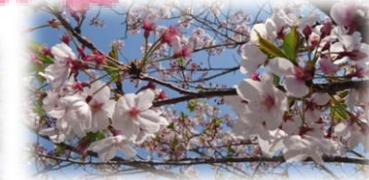
お天気の良い日に桜だけ撮り直しました